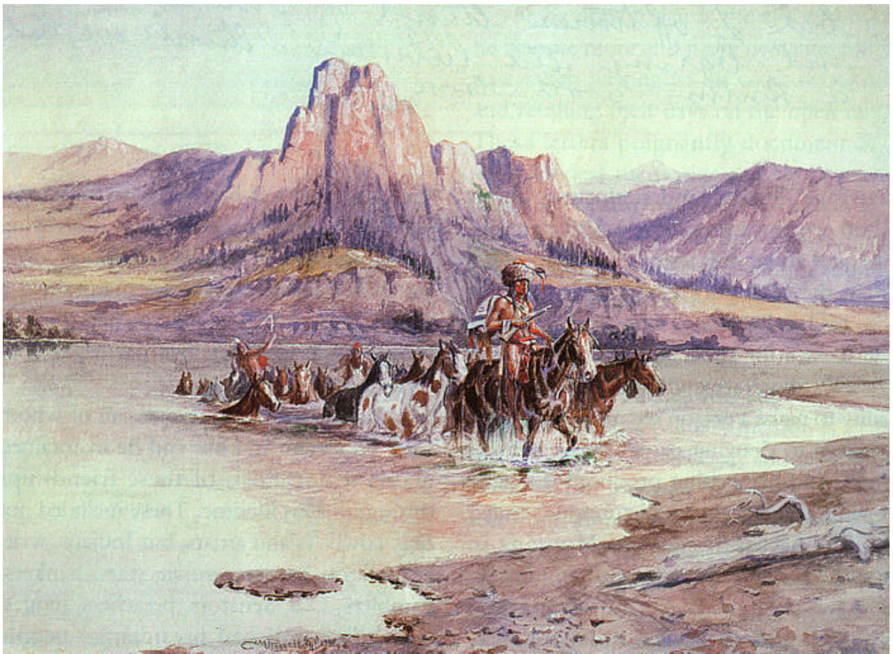
Return of the Horse Thieves, 1900, watercolor, C. M. Russell Museum.