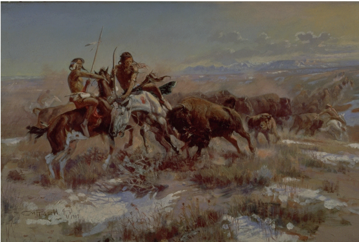
WOUNDED [The Wounded Buffalo] - 1909 Oil on canvas