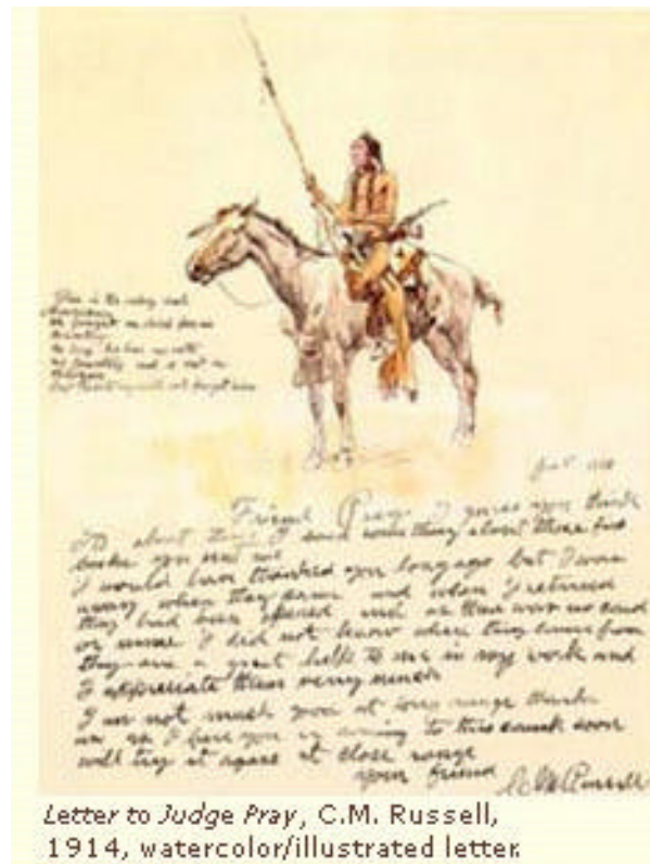
Letter to Judge Pray, C.M. Russell, 1914, watercolor/illustrated letter