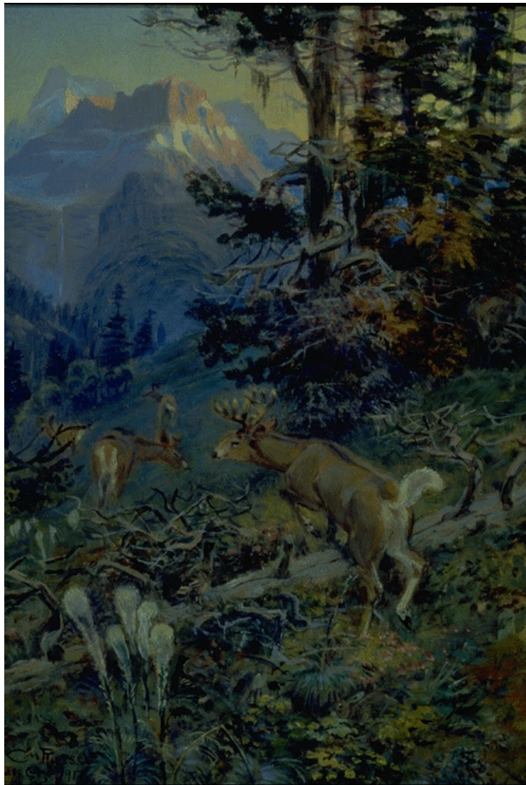
DEER IN FOREST [White Tailed Deer] - 1917 Oil on canvasboard