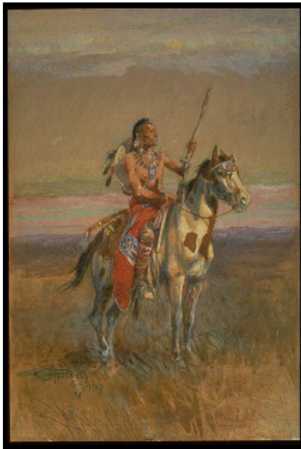
THE SCOUT - 1907 Pencil, watercolor, and gouache on paper