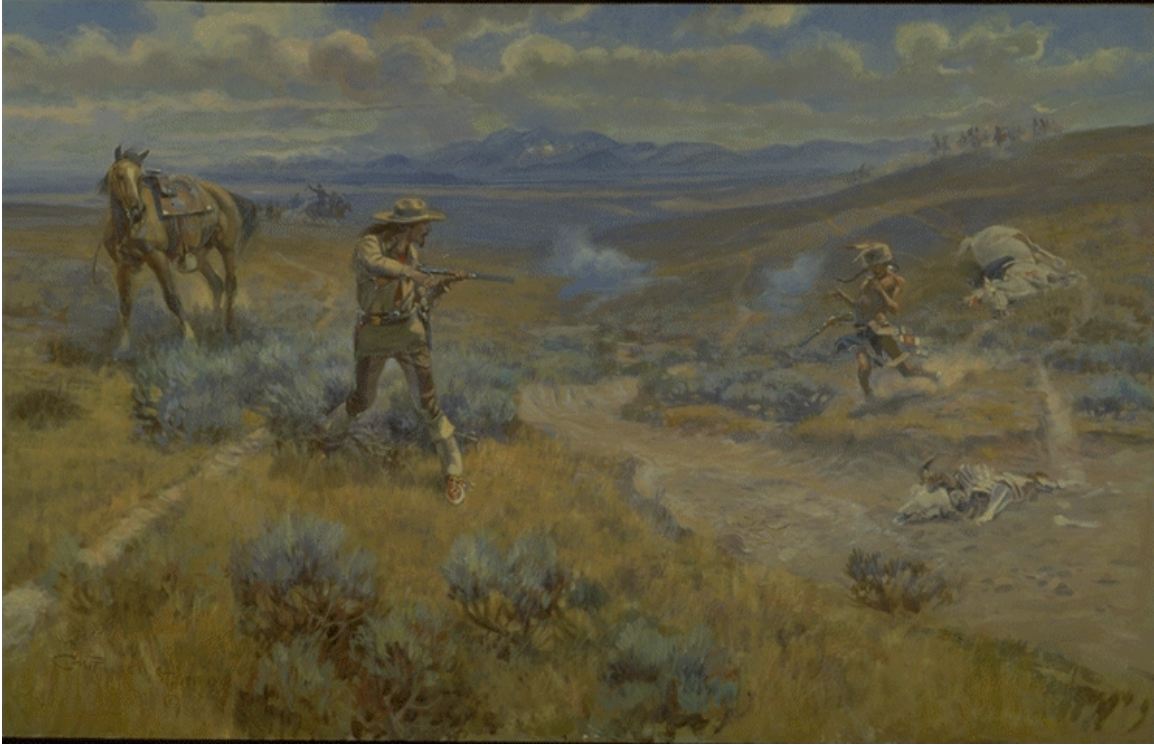
BUFFALO BILL'S DUEL WITH YELLOWHAND - 1917 Oil on canvas