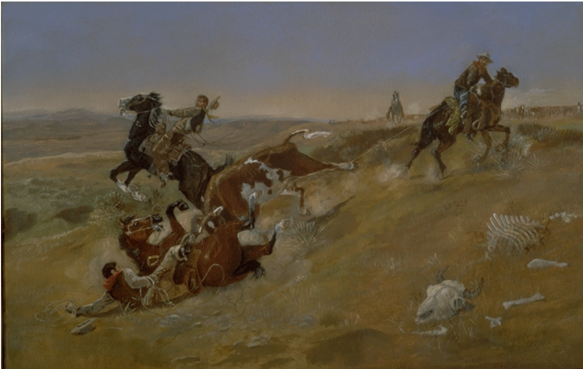
COW PUNCHING SOMETIMES SPELLS TROUBLE - 1889 Oil on canvas 26" X 41"