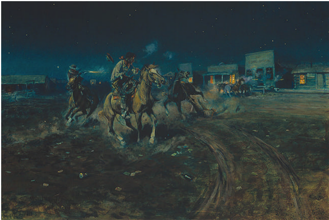
American, When Guns Speak, Death Settles Dispute - oil on canvas, Gilcrease Museum, Tulsa, Oklahoma