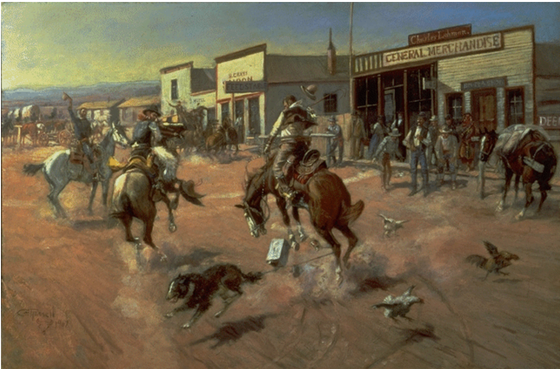
UTICA [A Quiet Day in Utica] - 1907 Oil on canvas