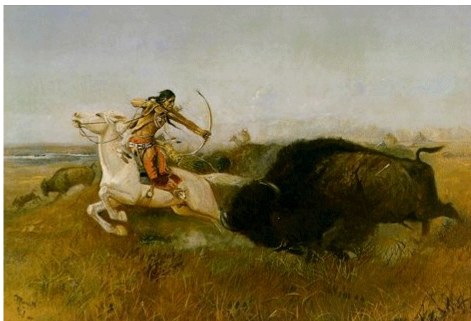
INDIANS HUNTING BUFFALO [Wild Men's Meat; Buffalo Hunt] - 1894 - Oil on canvas