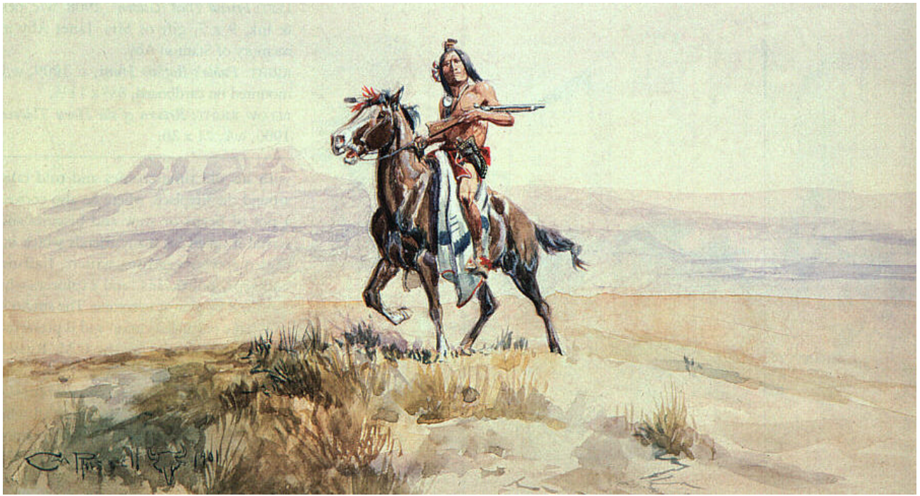
Red Man of the Plains, 1901, watercolor, C. M. Russell Museum