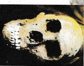
▲ L'Homme des Cavernes du Moustier. ▲ L'un des plus anciens crânes du type Néandertal découvert dans les grottes du Moustier.