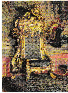
Trône de couronnement d'Éric XIV