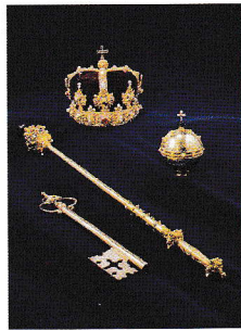
Les joyaux d'Éric XIV

Le Château royal est construit dans le style baroque italien sur les plans de Nicodemus Tessin le Jeune. Le Château a été achevé en 1754, en partie sur les vestiges de l'ancienne forteresse royale des Trois Couronnes (Tre Kronor) détruite en 1697 par un incendie. L'intérieur présente des exemples de meubles et de décoration datant principalement des 18 ème et 19 ème siècles.